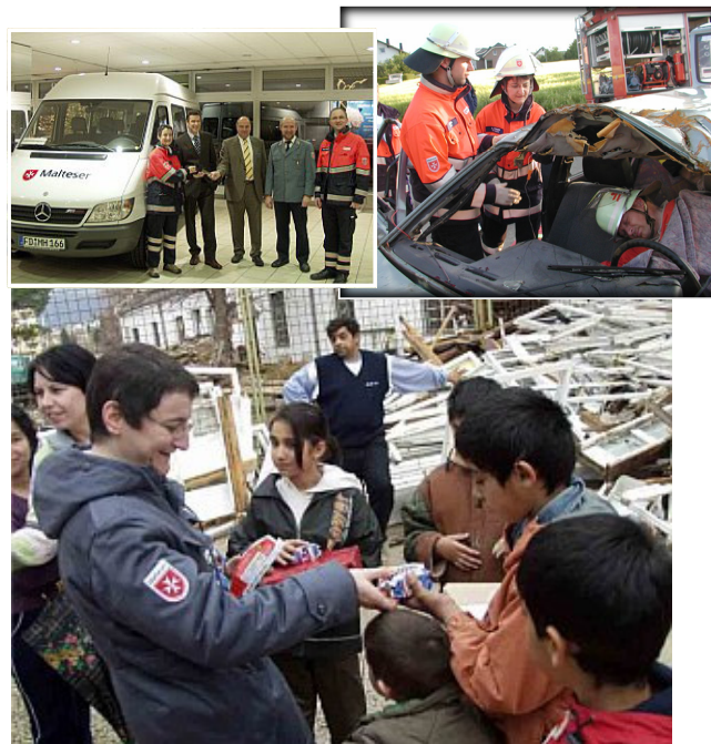
Sanitäts- und Betreuungsdienst, Arbeit im Auslandseinsatz: Alt und jung gemeinsam für die gute Sache freiwillig und im Ehrenamt zur Ehre Gottes und zum Heil der Menschen.