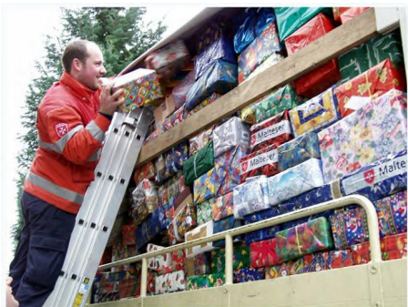
Weihnachtspäckchen für Kinder auf dem Balkan. Die Malteser versprechen Hilfe, die auch ankommt.

Ob auf dem Balkan oder an sozialen Brennpunkten vor Ort: Die Malteser helfen freiwillig und im Ehrenamt. Unterstützen Sie die Arbeit der Helfer in der Ausbildung, den Sozialdiensten, im Auslandsdienst, in der Kinder- und Jugendarbeit, in der Krisenintervention/Notfallseelsorge und in den Besuchs- und Begleitungsdiensten mit Ihrer Spende für die Stiftung „Glauben und Helfen“.